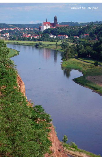
Elbland bei Meißen