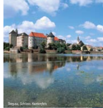
Torgau, Schloss Haztenfels

Strecke Wittenberg – Dresden Streckenlänge ca. 168 km Tagesetappen ca. 27 – 65 km Schwierigkeit leicht Buchungscode ELBE-WBDD