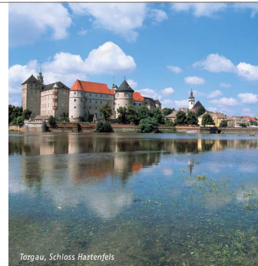
Torgau, Schloss Haxtenfels